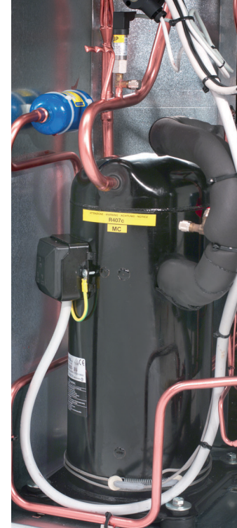
Ротационные и спиральные компрессоры, в зависимости от модели.

Абсолютно комфортные. Необходимость идти на компромисс при выборе блока CHA/CLK отпадает сама собой: блок занимает мало места и является бесшумным. Серия Compact Line снижает уровень звукового давления до минимума. Это было достигнуто благодаря нескольким аспектам, таким как оснащение блока пропорциональным электронным устройством для постоянного контроля за числом оборотов вентилятора, а также благодаря использованию ротационных и спиральных компрессоров (в зависимости от модели) с очень низким уровнем шума. Любые остаточные вибрации снижаются резиновыми амортизаторами, являющимися частью стандартных характеристик механизма.